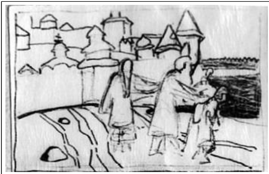
Н.К. Рерих. Из стольного города. Эскиз композиции 1900.

«Сочинил новый эскиз. Вещий баян – старик – с поводырём бредёт из стольного города по степи дорогою прямоезжею. Можно назвать «Из стольного города».