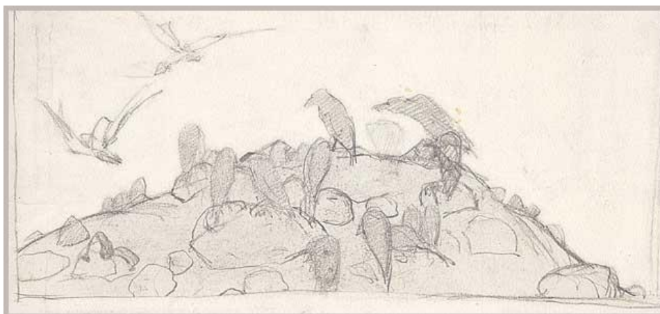
Н.К. Рерих. Вороны на кургане. Эскиз. 1900.

"Сегодня писал воронов, и, вероятно, до приезда к Тебе всё буду писать их же...."