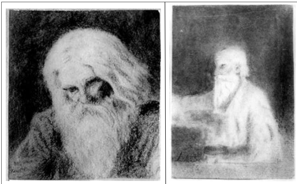
Н.К. Рерих. Старик. [1900].