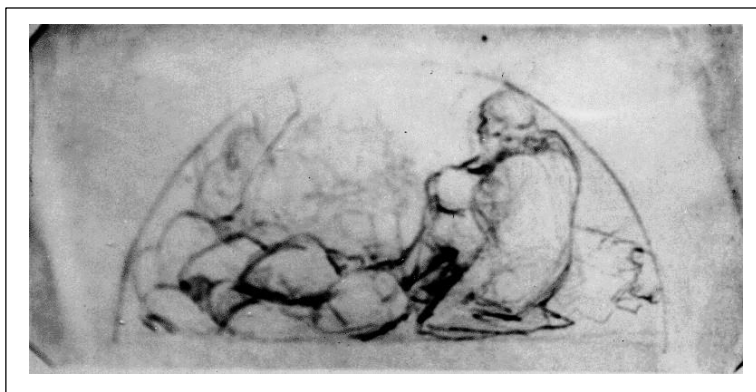
У очага. Набросок композиции к картине «Священный очаг». 1900.