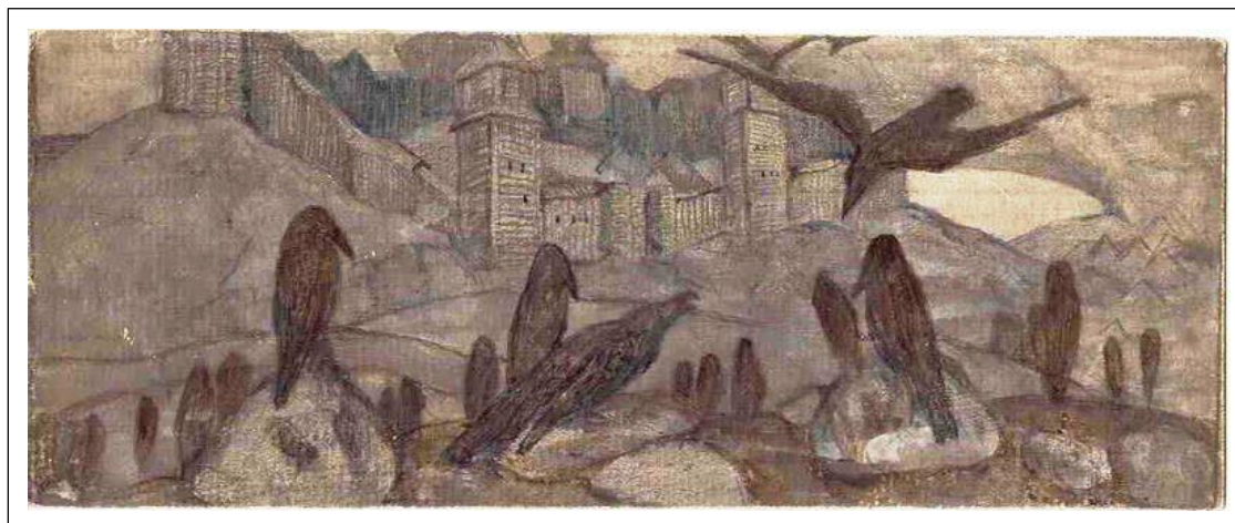
Н.К. Рерих. Вещие. 1901.