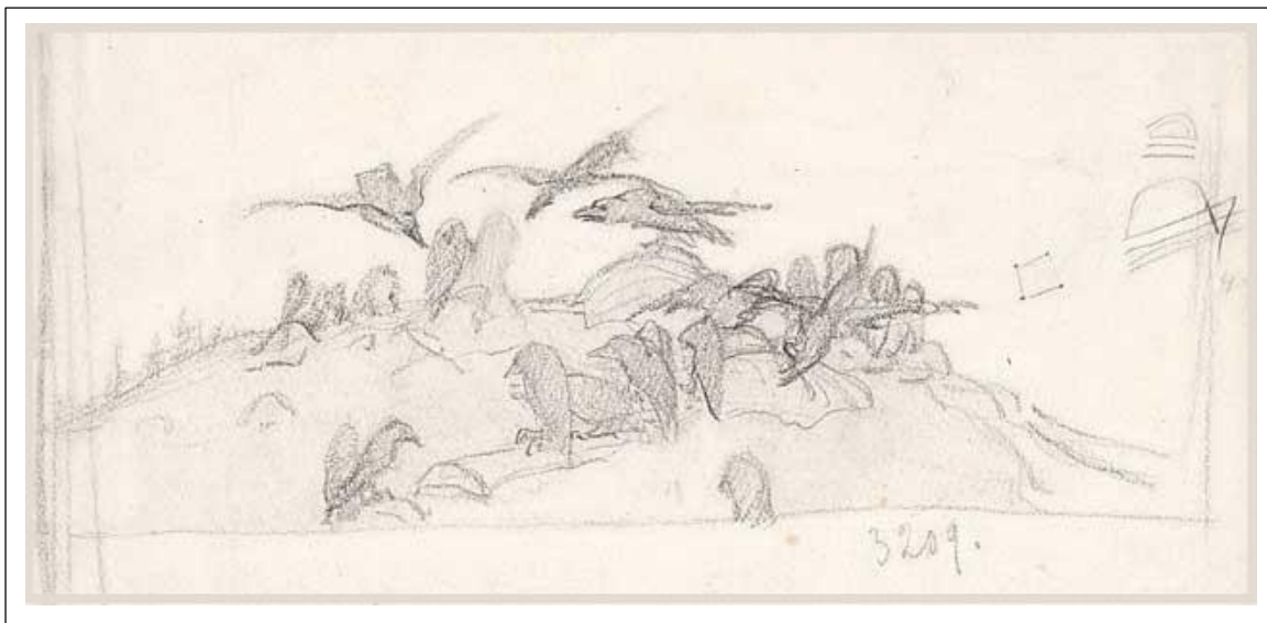
Н.К. Рерих. Вороны на кургане. Эскиз. 1900.